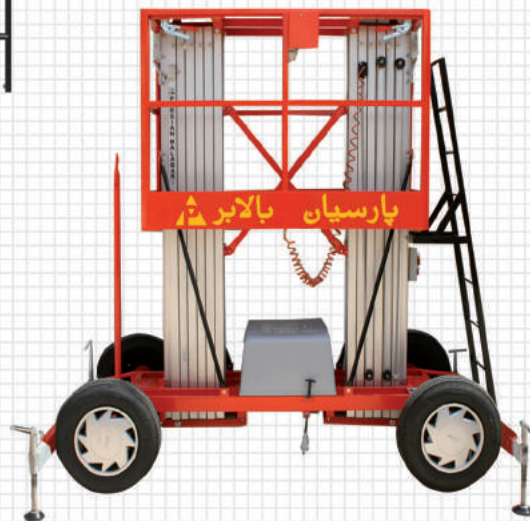
بالابر الکتروهیدرولیک دوریل پارسیان با چرخ خودرویی قابل یک مدل PB-DL Lorry wheeled electrohydraulic dual lift PB-DL model

Exclusive design of jack stand of Parsian Balabar sets provides a wide and safe confidence on surface.