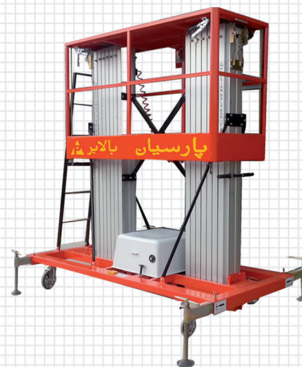
بالابر الکترو هیدرولیک دوریل پارسیان با چرخ کارگاهی مدل PB-D Workshop wheeled electrohydraulic dual lift PB-D model