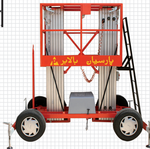
بالابر الکتروهیدرولیک دوریل پارسیان با چرخ خودرویی قابل یک مدل PB-DL Lorry wheeled electrohydraulic dual lift PB-DL model

Exclusive design of jack stand of Parsian Balabar sets provides a wide and safe confidence on surface.