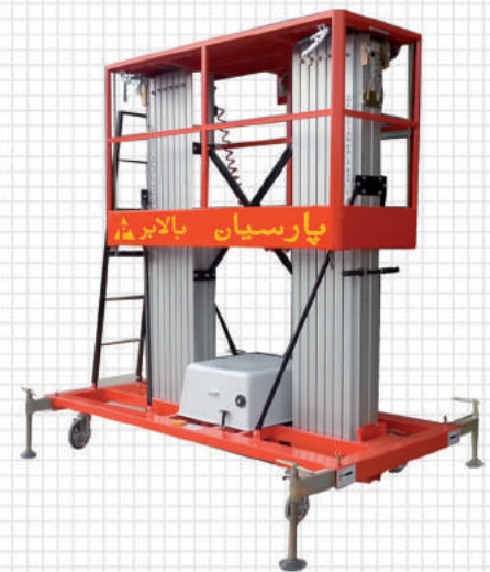
بالابر الکتروهیدرولیک دوریل پارسیان با چرخ کارگاهی مدل PB-D Workshop wheeled electrohydraulic dual lift PB-D model