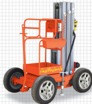
بالابر الکترو هیدرولیک تک ریل با چرخ خودرویی قابل یدک مدل های PB-L و PB-LW

Exclusive design of jack stand of Parsian Balabar sets provides a wide and safe confidence on surface.